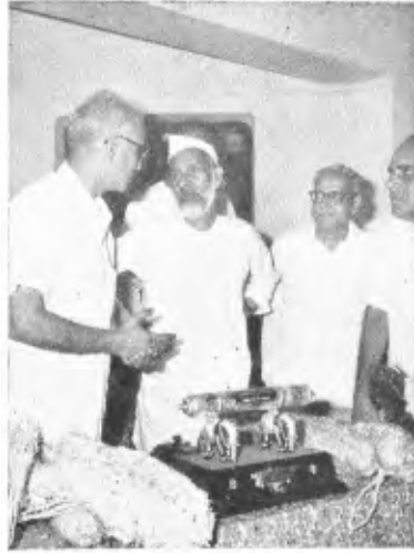
OFFERING OF CASKET WITH WELCOME ADDRESS